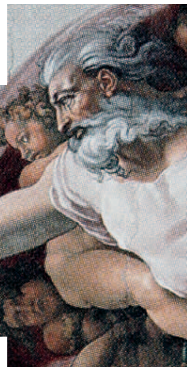
Adams Skabelse af Michelangelo, Det Sixtinske Kapel, 1510