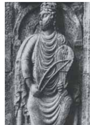
David er ofte fremstillet på kirkernes vestfacader, enten som selvstændig skulptur eller som en af Johannes åbenbarings '24 ældste'. Stenrelief, Santiago de Compostela, beg. af 1100

Alle hverdage afholdes morgenandagt i kirkens kor kl. 8.05-8.25. Andagten radiotransmitteres på DR P2.