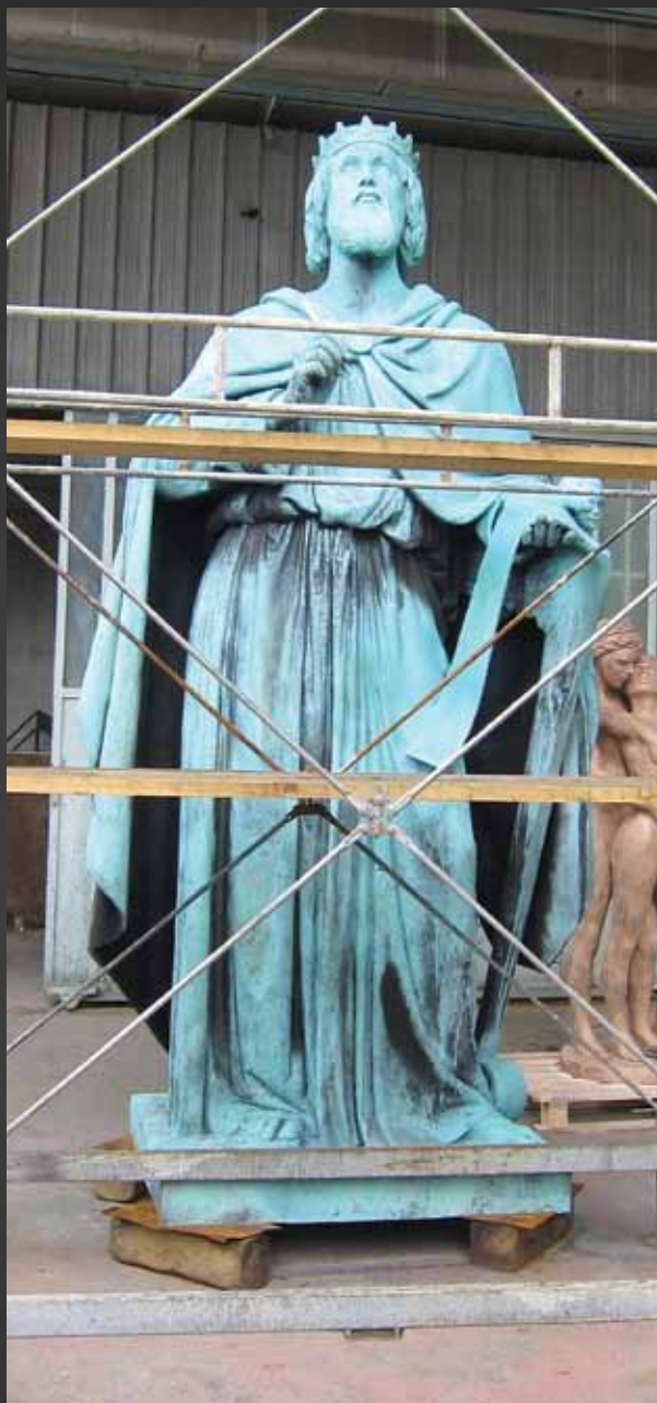
Den nye Davidstatue, Italien, november 2010