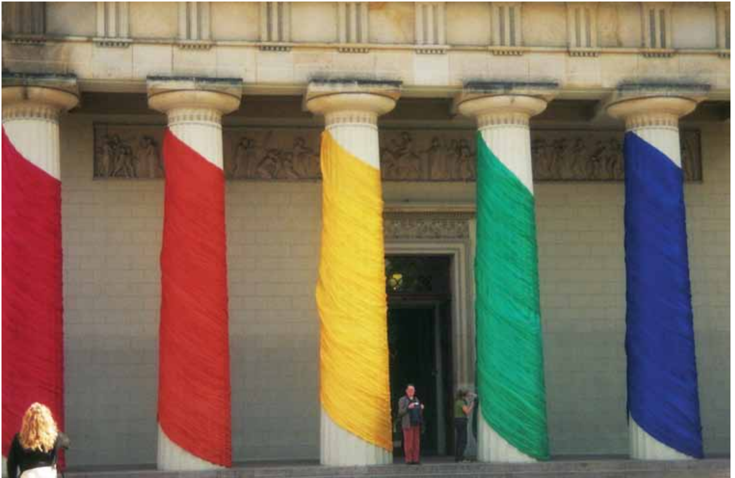
Domkirken klædt i regnbuens farver, Wold Outgames 2009.

› streret partnerskab. Til sammenligning indgås årligt omkring femogtredive tusinde vielser. Det er blevet sagt, at Danmark ikke kan være helt så sekulariseret, som vi plejer at forestille os, når forholdet mellem det registrerede partnerskab og kirken kan fremkalde så lidenskabelig diskussion, som tilfældet er.