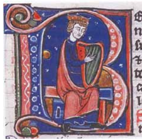
Initial B til Salme 1 i Salmernes Bog. Aslak Bolts bibel, Trondhjem, ca.1250

I England vil man til en Evensong kunne høre Davidssalmer sunget på de såkaldte 'chants', som er en flerstemmig videreudvikling af den gregorianske tradition. I Vor Frue Kirke er det fortsat de grego-