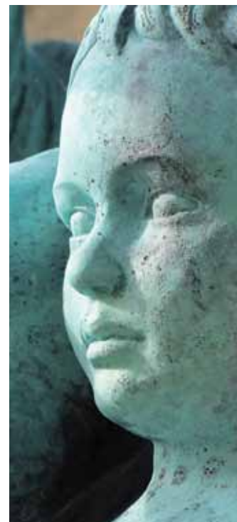
Fredag den 24. december kl. 15.30

* ICC – INTERNATIONAL CHURCH OF COPEN- HAGEN